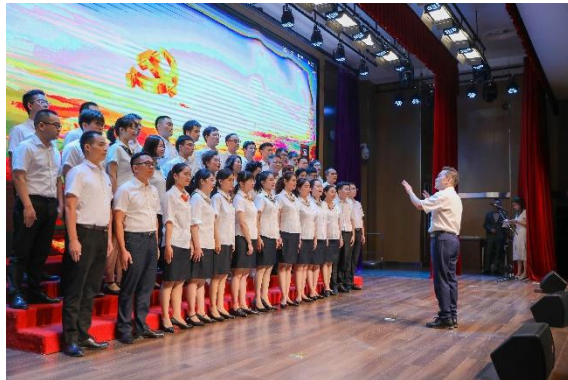
歌曲：《唱支山歌给党听》

择一事，终一生。会上还举行了新入职医生授袍宣誓仪式，新入职医师代表从医师前辈手中接过并穿上白袍，庄严宣读《中国医师宣言》，在誓言中感悟医生救死扶伤、治病救人的神圣职责。此外，医护人员还通过微视频、歌舞等形式，共庆节日，展示医者风采。一幕幕感人画面、一句句动听誓言，充分展现出荆州一医医务人员积极向上、奋发有为的精神面貌，提高了全院医务人员的职业自豪感、荣誉感和责任感。